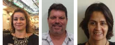
Suplente do Conselho Deliberativo